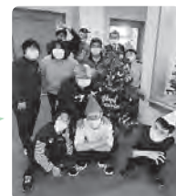
就労継続支援事業B型 さわやかの部屋

「楽しみにしていたクリスマス会が出来てうれしかったです。ありがとうございます!」