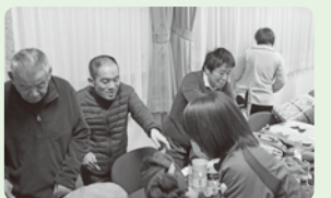
障害者支援施設 あすかの家から“ありがとう”

今年度も年末年始に心あたたまる事業を展開するため、皆様の温かいご支援とご協力をよろしくお願い申し上げます。