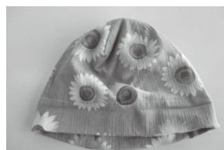
＜スモースニットの帽子＞

※はまなすの会とは、2017年に発足した西播磨初のがん患者会です。現在、帽子の材料となる新しいタオルやガーゼなどを募集しています。