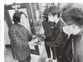
年末ふれあい弁当