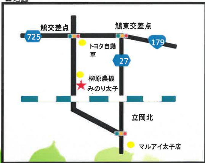
社会福祉法人 みのり