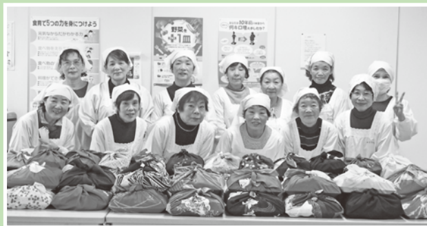
年末ふれあい弁当配食事業

「歳末たすけあい運動」は共同募金運動の一環として、新たな年を迎える時期に、自治会、社会福祉協議会等の関係機関・団体の協力のもと、支援を必要とする高齢者、障がい者、児童等が安心して暮らすことができるよう住民の理解とあたたかい善意の募金により様々な福祉活動を重点的に展開するものです。