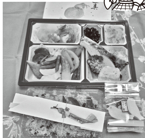
昨年度のふれあい弁当