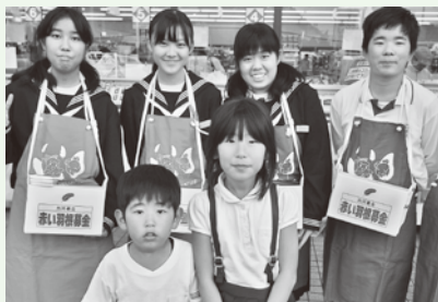
中学生の協力による街頭募金の様子