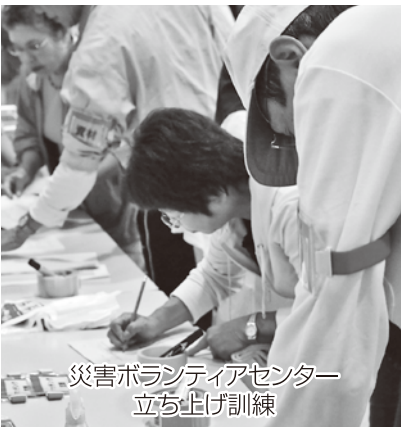
災害ボランティアセンター立ち上げ訓練

アについて学び体験する機会として各種ボランティア講座を開催しました。（全12講座 延333名参加）