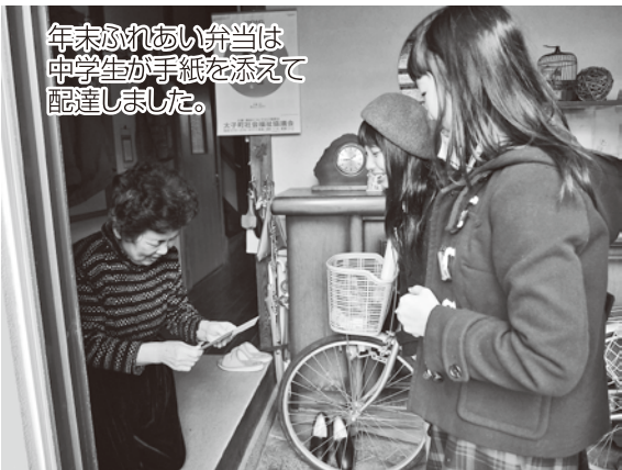
年末ふれあい弁当は中学生が手紙を添えて配達しました。