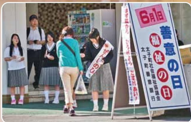
JR網干駅前での啓発活動

兵庫県では昭和39年に6月1日を「善意の日」と制定し、本会でも6月を善意月間と位置付けています。本年度も啓発活動として、6月1日にJR網干駅前では太子高等学校のボランティア部の生徒さんの協力のもと、通勤・通学の皆さんに啓発ティッシュを配布させていただきました。