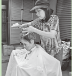
訪問理美容サービス