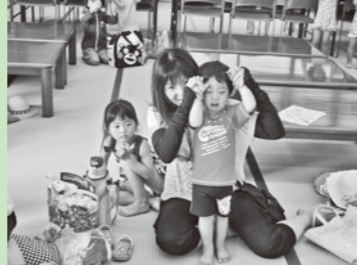
まちの子育てひろば