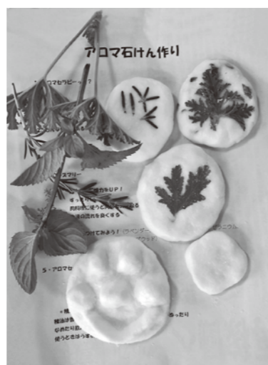
今年のアロマ石鹸作品