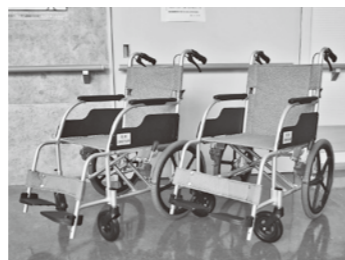
寄付いただいた介助用車いす