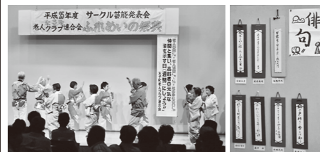
昨年度のふれあいの祭典