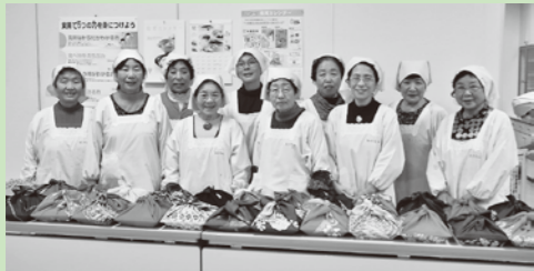
給食配食ボランティア

太子町社会福祉協議会では、赤い羽根共同募金配分金をこのような福祉活動に使わせていただきます。