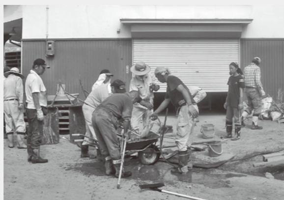
平成21年佐用水害時の災害ボランティア活動風景

日 時 平成26年10月3日(金) 9:30～13:00 受付場所 太子町保健福祉会館1階 ロビー 内 容 ①災害ボランティアセンター立ち上げ訓練 ②災害ボランティアセンター受付体験 ③資材を使っの炊き出し訓練 服 装 汚れても良い動きやすい服装(長袖着用)、長靴(安全靴でも可)、帽子、軍手、水筒 申込み先 太子町社会福祉協議会ボランティアセンター ☎276-6632