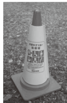
【駐車場での設置例】