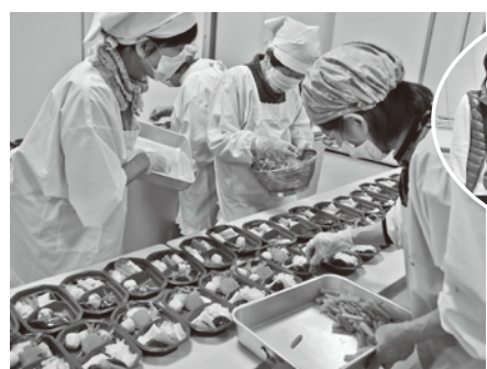
年末ふれあい弁当配食事業

「歳末たすけあい運動」は共同募金運動の一環として、新たな年を迎える時期に、自治会、社会福祉協議会等の関係機関・団体の協力のもと、支援を必要とする高齢者、障がい者、児童等が安心して暮らすことができるよう住民の理解とあたたかい善意の募金により様々な福祉活動を重点的に展開するものです。