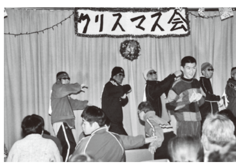
障害者支援施設 あすかの家クリスマス会