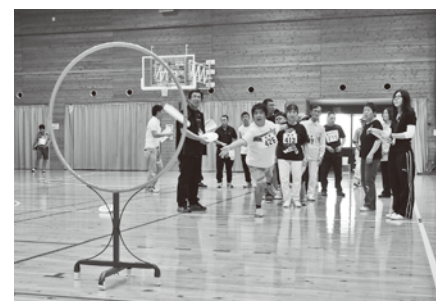
フライングディスクに挑戦! よ〜く狙って、入れ〜!!

9月7日(土)、西播磨総合リハビリテーションセンター体育館において第44回西播磨福祉地区障害者スポーツ大会が開催されました。太子町からは、身体障害者福祉協会と手をつなぐ親の会会員が選手として「太子くん」のチーム名で参加し、佐用町3チーム、上郡町2チームの選手たちと様々な競技種目で競い合いました。