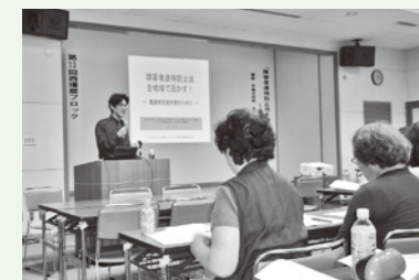
又村氏の講演を熱心に聴く会員