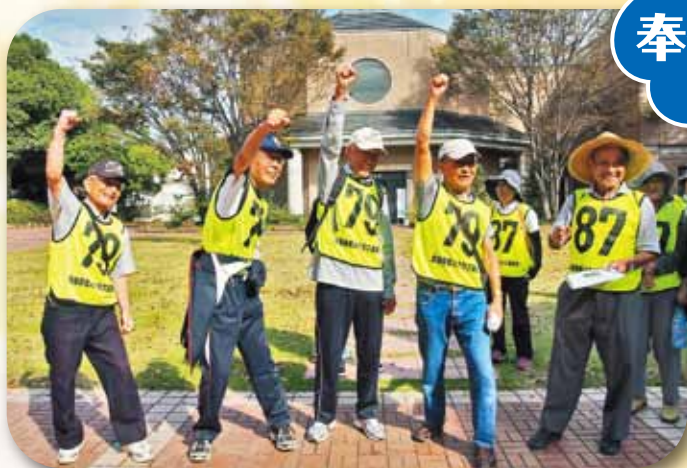
健康ウォークラリー大会