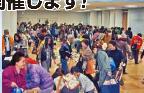
昨年度の様子 ※昨年度は雨天のため室内で実施しました

天候等の都合による時間等変更や、危険防止のため入場制限をすることがありますので、あらかじめご了承ください。