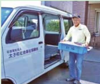
給食配食ボランティア

「共同募金」は、民間の社会福祉事業を支援することを目的とした「社会福祉法」に定められている募金運動で、10月1日より全国一斉に行われる都道府県を単位とする計画募金です。