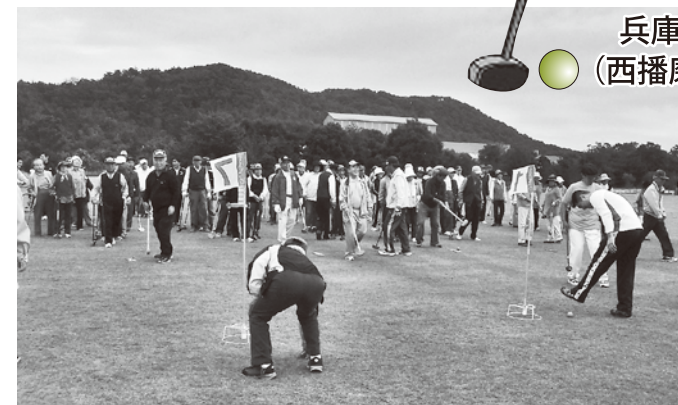
昨年度のホールインワンゲームの様子

兵庫県身体障害者福祉協会 西播ブロック協議会 (西播磨リハビリテーションセンター長杯)開催のお知らせ