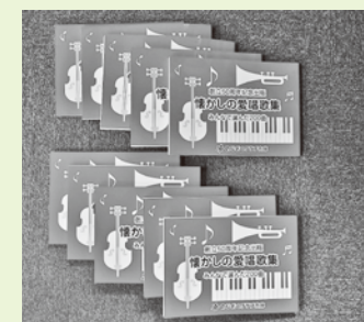
懐かしの愛唱歌集 10冊