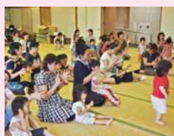
まちの子育てひろば