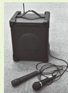
スピーカーセット