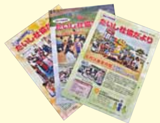
社協だよりの発行

障害者支援施設『あすかの家』では今年度、兵庫県共同募金会から施設臨時費配分900,000円を受けて、洗濯機と乾燥機を購入されました。