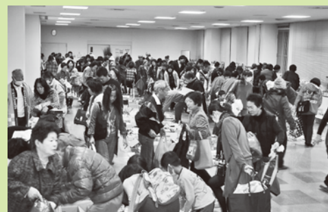
昨年度の様子 ※昨年度は雨天のため室内で実施しました。

日時：平成25年11月10日(日) 9:30～11:30 場所：太子町保健福祉会館中庭 (老原102-1)