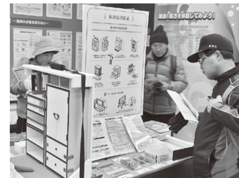
神戸市危機管理センター防災展示室の見学