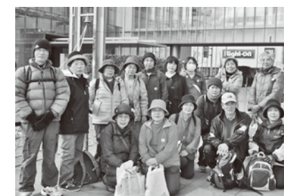
ウォーキングを終えた参加者