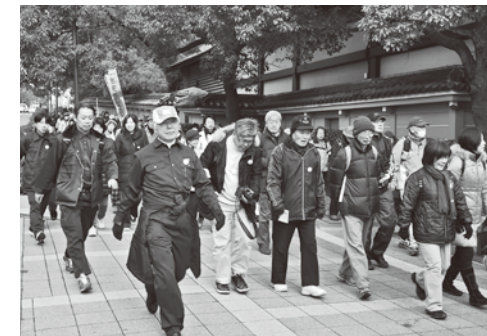
神戸市立中央体育館から出発!