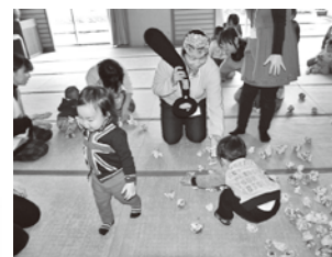
(2月行事: 豆まきの様子)