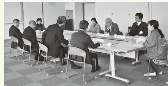
運営委員会の様子