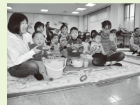
昨年度のミニフェスティバルの様子

★☆☆太子町では、次のような所でひろばを開設しております。ぜひ、気軽にご参加ください☆☆☆