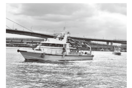
海上防災訓練の様子

今年度も「1.17ひょうごメモリアルウォーク」に太子町から20名の方が参加され、晴天に恵まれた神戸の街、約5キロコースを歩きました。ゴールのH A T神戸では、起震車での地震体験、防災啓発展示や海上防災訓練の見学に参加された方もあり、防災意識を再確認した一日となりました。