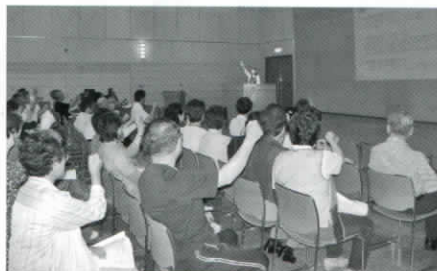
「ジャンケンで私に負けるものを出してください。」 簡単なゲームですが、なかなか難しい。

今回の社協だよりではその内容を少し紹介いたします。かつては『痴呆』と言われ2004年に名称を改められた『認知症』、その認知症にならないために、普段の生活の中でも注意すれば予防につながるがありますよ。