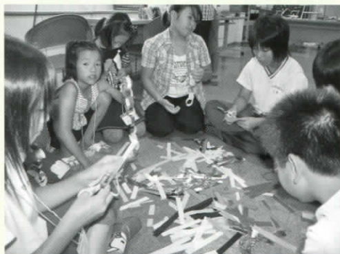
[小学生と出店の飾りつけをしました]