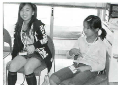
（手話体験では、手話も習いました）

「ちょボラン体験隊」は、現在若干人数に余裕があります。年間を通して参加できる方はボランティアセンター（電話276-6632）までお問い合わせください。