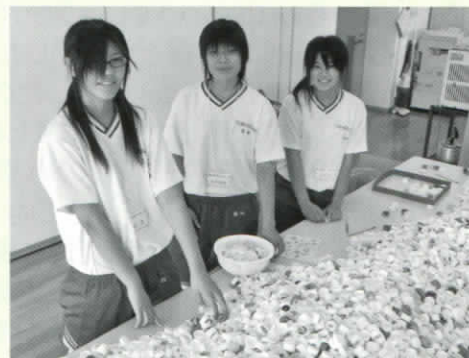
(写真は東中の皆さん)