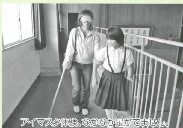
アイマスク体験、なかなか足がでません。

手話体験はボランティアグループ「手話サークルぶらんこ」、アイマスク体験はボランティアグループ「やわらぎ」、車いす体験は社協の職員が行いました。