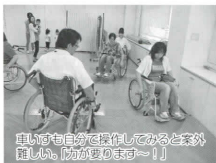
車いすも自分で操作してみると案外難しい。「力が要ります〜!」