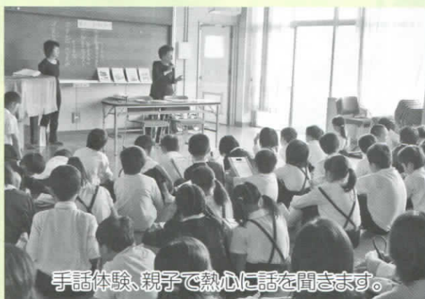
手話体験、親子で熱心に話を聞きます。

10月8日（金）、太田小学校PTAによる「親子ふれあい福祉体験」が開催され、社協職員とボランティアグループが体験のお手伝いをしました。この体験は毎年行われており、今年は児童185名とその保護者が参加し順番に3つの体験コースを回り、手話体験、アイマスク体験、車いす体験をそれぞれ親子や児童同士で体験しました。