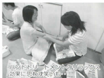
ハンドトリートメントのリラックス効果に思わず笑いも...