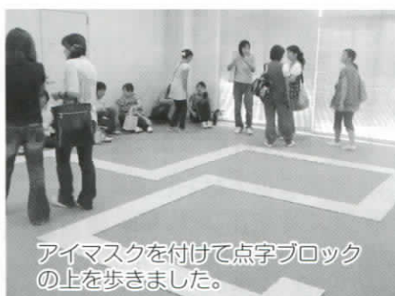
アイマスクを付けて点字ブロックの上を歩きました。