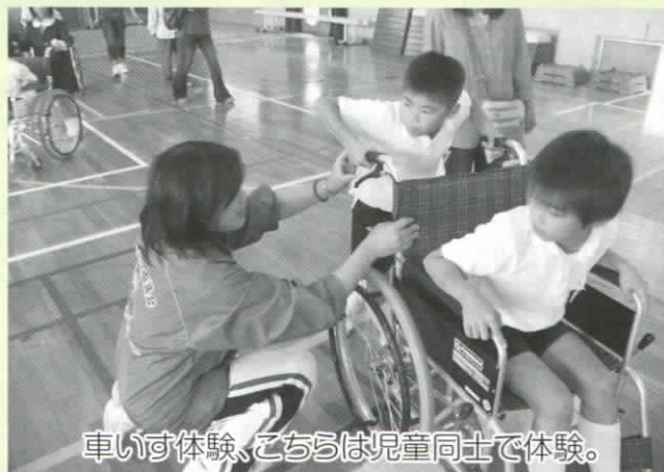
車いす体験、こちらは児童同士で体験。

短時間での体験となりましたが、普段聞くことのできない話を聞くこともでき、良い体験の機会になったのではないのでしょうか？