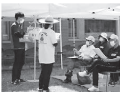
【災害ボランティアセンターの立ち上げ訓練】