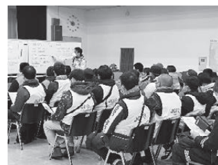
【現地、朝のオリエンテーション】

今後も被災地域への義援金や活動者のための支援金募金など、能登半島地震の復旧、復興支援に皆さまと共に寄り添っていきましょう。ご協力のほどよろしくお願いいたします。