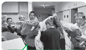
もこもこ暖かいね〜!!