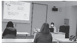
「小児の栄養と食生活」