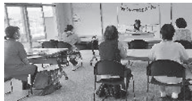
「絵本について」(読み聞かせ)