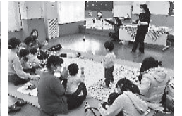
「親子遊び」クリスマス会