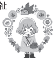
兵庫県共同募金マスコット「あかはねちゃん」