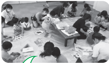
絵の具で遊ぼう!の様子