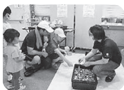
〈ボールすくいとはれたかな？〉