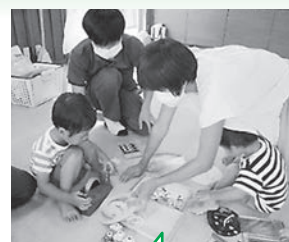
昨年の工作活動の様子。

★☆☆太子町では、次のような場所でひろばを開設しています。ぜひ、気軽にご参加ください☆☆★