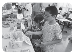
〈いろいろ売ってるね～〉