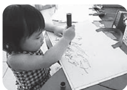
〈工作コーナーでお絵かき〉

8月11日に、太子町保健福祉会館においてONEDAYショップを開催しました。ボランティアグループや福祉サービス事業所による出店や写真撮影コーナー、工作コーナーには、多くの方や家族連れが訪れ、楽しめました。