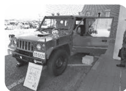
〈自衛隊ジープにも乗れたよ〉