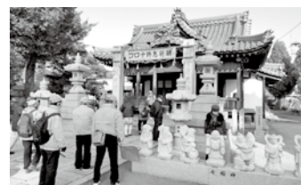
町老連(ひまわりシニア太子)

老人クラブ連合会、身体障がい者福祉協会、遺族会の事務局を兼務し、活動の支援、援助を行います。