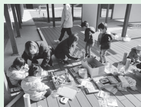
竹ランタンづくり