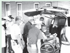
移送グループによる移送の様子 (研修会)