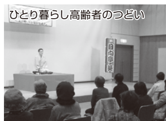
ひとり暮らし高齢者のつどい