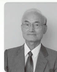
太子町社会福祉協議会