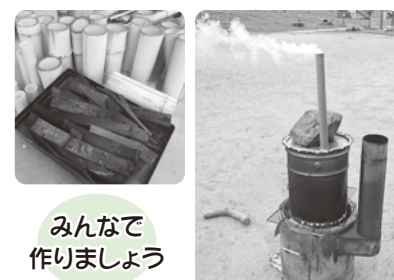
みんなで作りましょう