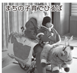
まちの子育てひろば