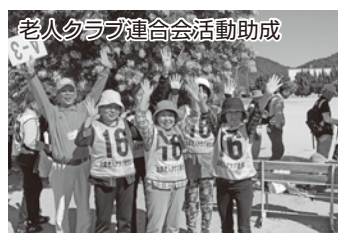
老人クラブ連合会活動助成