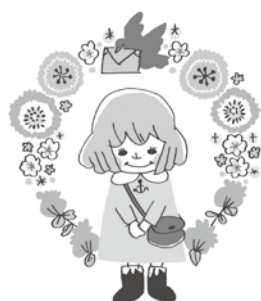
太子町共同募金委員会

太子町社会福祉協議会では、給食サービスや移送サービスなどの在宅福祉事業やボランティア活動の推進など、『みんなのまち太子町』の福祉推進の貴重な財源として活用させていただきます。