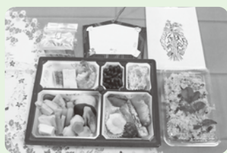
昨年の年末ふれあい弁当

毎年恒例の年末ふれあい弁当を今年度も12月28日(金)に実施します。社協の給食サービス利用者のうち希望される方59名に、調理ボランティア手作りの真心のこもった弁当を、町内の中学生ボランティアが笑顔を添えてお届けいたします。