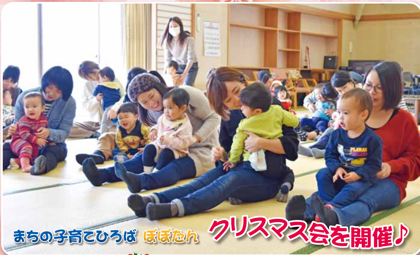
まちの子育てひろば ぽぽたん クリスマス会を開催♪