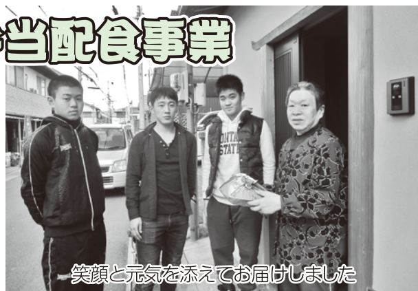
笑顔と元気を添えてお届けしました