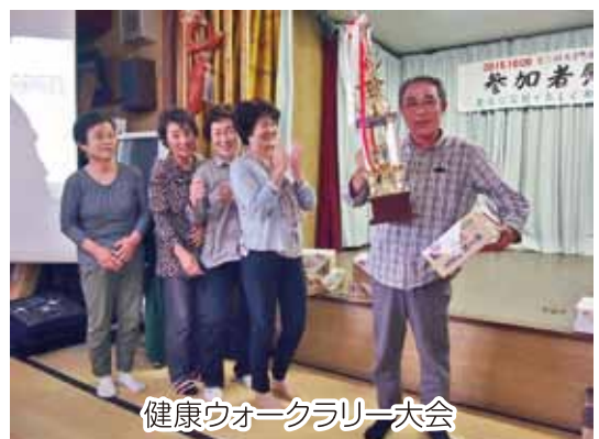
健康ウォークラリー大会