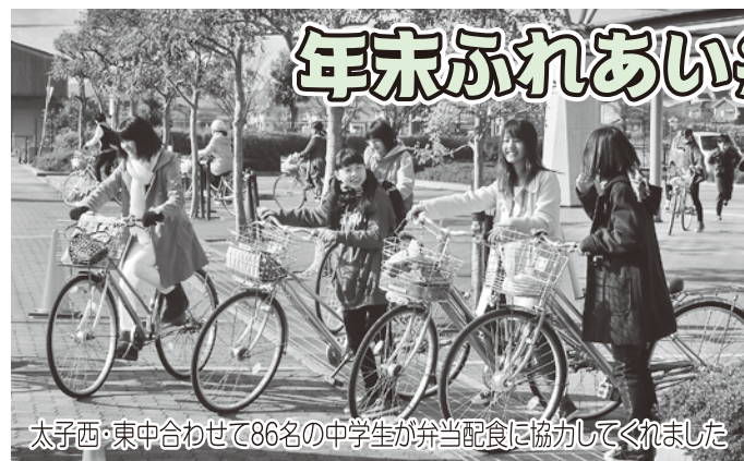
太子西・東中合わせて86名の中学生が弁当配食に協力してくれました

12月より自治会を通じて町民の皆様にご協力をお願いしましたところ、多くの募金を集めることができました。お寄せいただきました募金により、下記の年末ふれあい弁当配食事業（友愛訪問）をはじめとする社協歳末事業の実施や、町内および近隣の6つの福祉施設に配分させていただきました。皆様の温かいご協力に心より感謝申し上げます。