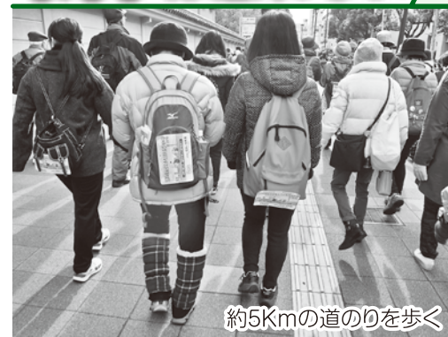
約5Kmの道のりを歩く

1月17日…この日を様々な思いで迎えられたのではないのでしょうか。社会福祉協議会（以下社協）では、今年も1.17メモリアルウォークに参加しました。社協ではつどい1.17に使用される竹灯ろうを毎年神戸に送り、阪神淡路大震災の記憶を語り継ぐ行事に協力しています。（社協だより1月号に掲載）12月12日に行った竹灯ろう作りには多くの中学生も参加し、若い世代にも震災について知ってもらう機会となりました。今回はメモリアルウォークに参加し、神戸の街を歩いた方のお届けします。