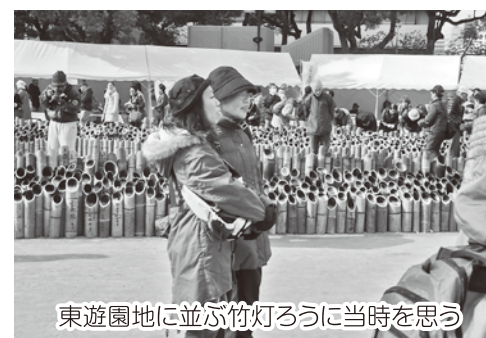
東遊園地に並ぶ竹灯ろうに当時を思い出す

あの震災から21年経った街並みを見ると、ちゃんと復興したのを見ると人の力ってすごいなと思いました。今回のウォークで震災の体験ができて良かったです。忘れないように心の中に残していきたいと思います。（小学生）