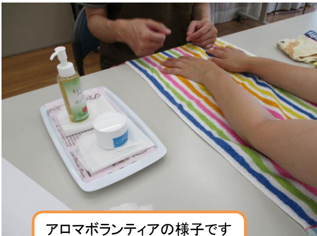
アロマボランティアの様子です ハンドトリートメントを行います

※ 依頼があれば、社協職員がレクリエーションやゲーム、災害時の話を行います。 サロンやときめきスクール等に訪問させていただきますので、気軽に日程や時間をご相談ください。