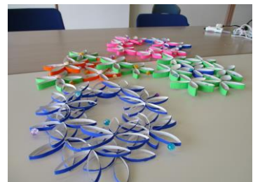
社協職員が、 サロンにお伺いして、 体操や工作、レクを します！